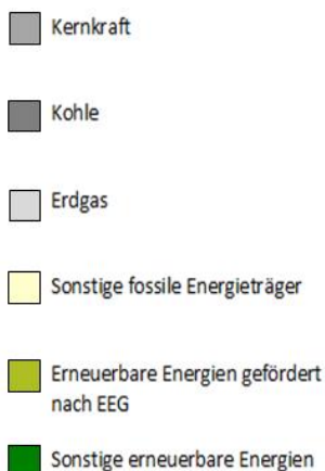
Gesamtstromlieferung des Unternehmens

Stromkennzeichen gemäß § 42 Energiewirtschaftsgesetz vom 7. Juli 2005 geändert 2020